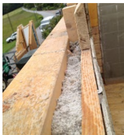
Die in den Außen- und Zwischenwänden zur Dämmung eingebrachte Zellulose wies nach 21 Jahren...