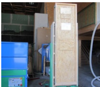
ISOCELL Zellulose auf dem Prüfstand - der „Rütteltest“