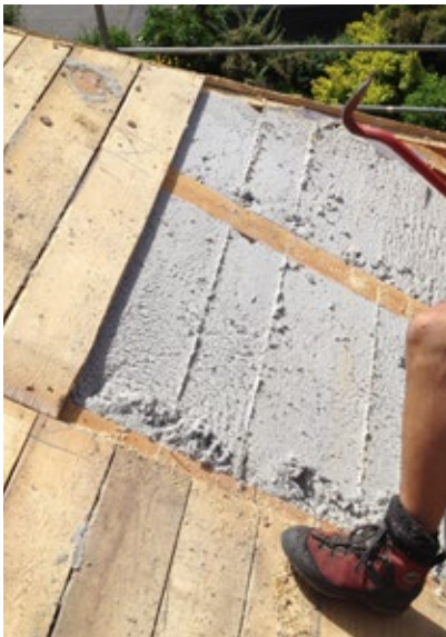
Nach 17 Jahre geöffneter Dachstuhl; Die ISOCELL Zellulose wirkt wie frisch eingblasen.

Neben ihrem hohen Wärmedämmwert punktet Zellulose von ISOCELL vor allem mit Passgenauigkeit und Setzungssicherheit. Das Abbauen eines 21 Jahre alten Fertigteilhauses im Musterhauspark „Blaue Lagune“ in Wiener Neudorf lieferte einen eindrucksvollen Beweis für die Zuverlässigkeit und Langlebigkeit des Dämmstoffs: Die Zellulose wies keinerlei Spuren von Setzung oder Verformung auf und wirkte selbst nach mehr als zwei Jahrzehnten „wie frisch eingblasen“. Beim Dachausbau eines 17 Jahre zuvor gedämmten Hauses in Tirol im Frühjahr 2014 zeigte sich das gleiche Bild.