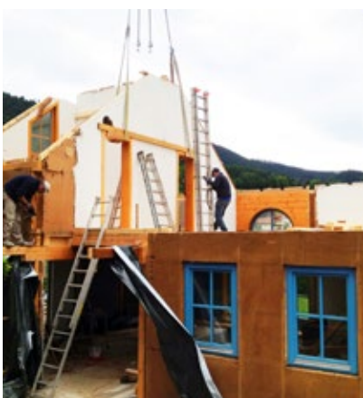
Nach 21 Jahren wird das Fertigteilhaus abgebaut. Beim Abtragen zeigte sich deutlich:

21 Jahre leistete das in Holzriegelbauweise errichtete und mit Zellulose von ISOCELL gedämmte Fertigteilhaus der Firma „Pronaturhaus“ im Musterhauspark „Blaue Lagune“ in Wiener Neustadt wertvolle Dienste. 2013 wurde es abgetragen, um nach dem Wiederaufbau seine zweite Lebensphase als „echtes“ Wohnhaus in einem rund 30 Kilometer entfernten Dorf anzutreten. Beim Abtragen des Musterhauses bot sich eindrucksvoll der Beweis für die Zuverlässigkeit und Langlebigkeit des eingblasenen Dämm-Materials. Die in den Außen- und Zwischenwänden zur Dämmung eingebrachte Zellulose wies selbst nach mehr als zwei Jahrzehnten im Einsatz keinerlei Anzeichen von Zusammensinken, Verformung oder sonstiger Qualitätsminderung auf. Josef Schedelmayer, Gesellschafter der Pronaturhaus Obritzberger GmbH aus Gösing, zeigte sich begeistert: „Die Zellulosedämmung wirkte in allen Belangen wie frisch eingblasen. Das ist beeindruckend, wenn man bedenkt wie andere Dämm-Materialien oft schon nach wenigen Jahren aussehen.“ Ein anderes Beispiel für die Langlebigkeit und Formbeständigkeit von ISOCELL-Zellulose bot sich beim Dachausbau eines 17 Jahre zuvor gedämmten Einfamilienhauses in Tirol im Frühjahr 2014. Auch hier stießen die Arbeiter auf eine unversehrte, lückenlose Dämmschicht.