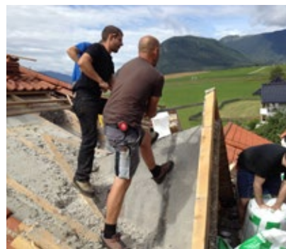
... in Säcke gefüllt und wiederverwendet.