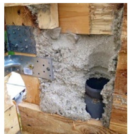
...keinerlei Spuren von Setzung oder Verformung auf.