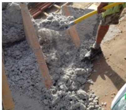
... wird nach dem Freilegen...