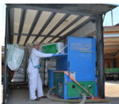
Eine starke Maschine im LKW befördert das Material durch den Schlauch bis zu den vorgefertigten Hohlräumen.