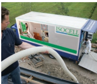
Der Schlauch wird an den Einsatzort gebracht.