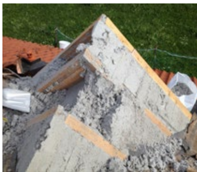
Die nach 17 Jahren unversehrte und saubere Zellulose...